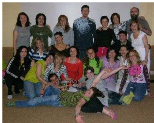
Taller de Todo Amor Abril