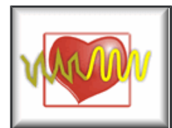
Taller de Coherencia Cardíaca

El Taller incluye las técnicas, el software, y su explicación y manejo. Si traes tu portátil, lo instalamos sobre la marcha.