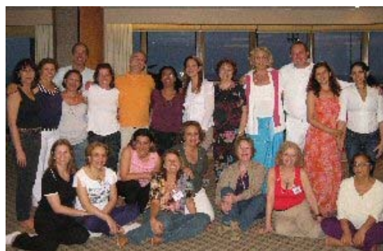
Taller Todo Amor

En el curso de conectar con tus guías, tuvimos unas conexiones muy intensas y muy bonitas, y en Ho´Oponopono, me sorprendió encontrarme con un grupo de personas que en su mayoría llevaban tiempo usando Ho´Oponopono y se habían bajado el Webinar que hice el año pasado.