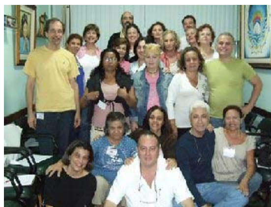
Conectar con tus Guías