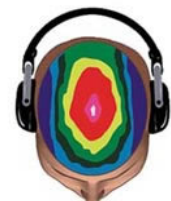
Patrón normal de ondas cerebrales altamente enfocado y su potencial desarrollado