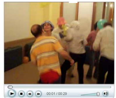
Taller de Risoterapia