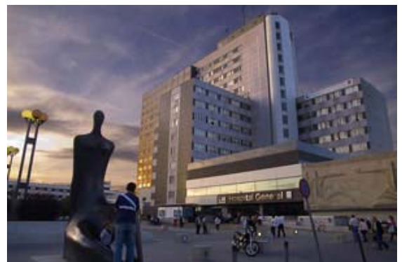
Hospital La Paz

Por otra parte, los intercambios de Reiki serán solo para los que han asistido a la meditación y/o los colaboradores de la Fundación. Por lo cual, si vienes a las 21.30 sin venir a la meditación, asegúrate que traes tu carné de colaborador ya que tendrás que presentarlo en recepción. Además, para que no haya interrupciones una vez empezado el intercambio, a partir de las 21.45 se cierra el acceso a la sala grande para los que quieren venir al intercambio (aún siendo colaborador).