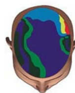
Patrón normal de ondas cerebrales con un enfoque limitado